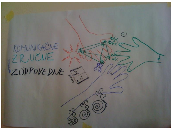
Obr. 5: Vzdelávanie tímov vzájomnej pomoci (Púchov 05.3. 2013)