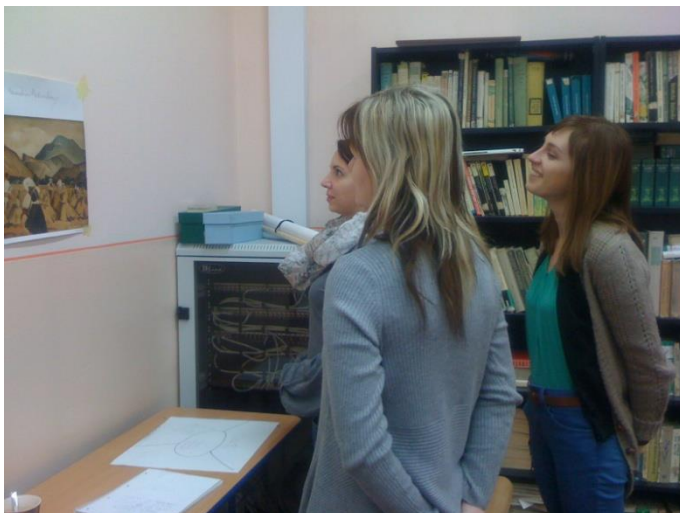
Obr.1: Vzdelávanie tímov vzájomnej pomoci (Púchov 11.2.2013)

Treba dodať, že reflexia školských pedagogických tímov a lektoriek participujúcich na tréningovom programe je veľmi pozitívna. Stretnutia sú realizované v priateľskej atmosfére, v každej asociovanej škole sa stretli pedagógovia, ktorí aktívne vnímajú zmenu roly učiteľa na vyučovaní.