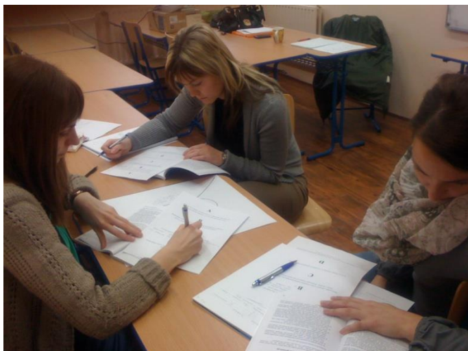
Obr.3: Vzdelávanie tímov vzájomnej pomoci (Púchov 11.2.2013)