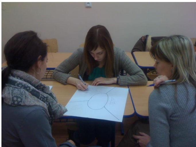
Obr.2: Vzdelávanie tímov vzájomnej pomoci (Púchov 11.2.2013)